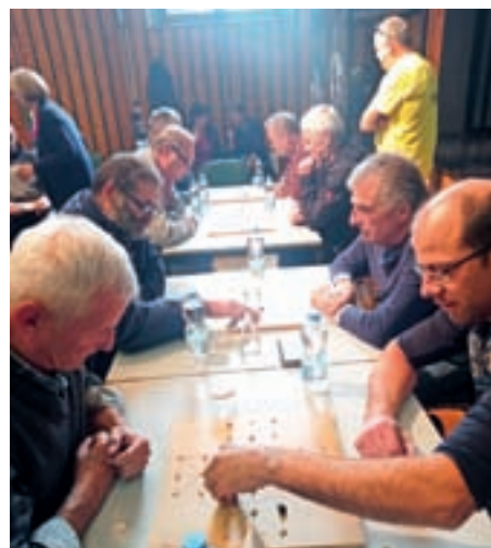
Prvi turnir v igranju vovkalce na Sovodnju

je z dvema volkovoma uspelo pojesti več kot devet ovac. Pastir ovac pa je zmagal, če je prignal v hlev devet ovac. Pod budnim očesom komisije so tekmovalci zbrano igrali po pravilih, ki so jim bila znana že vnaprej. Preostali obiskovalci so navijali za izbrane kandidate. Nekateri so v »vovkalc« odigrali tudi prijateljske partije med seboj. Po dveh igrah so si tekmovalci privoščili nekaj oddiha. Takrat so tri učence Podružnične šole Sovodenj prikazale pripravo testa in izdelavo drobnjakovih štrukeljcev. Preprosti in nasitni »drobnjakovi štrukli na žup« so bili včasih pogosto na jedilniku po naših vaseh in na širšem škofjeloškem območju. Danes se izdelava štrukljev nekoliko razlikuje po krajih ter sodobnih težnjah gospodinjin jedcev. Učenci so v lanskem šolskem letu o poznavanju in pripravi te hrane doma izvedli anketo, letos pa bodo vse skupaj