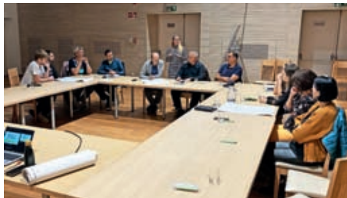
Udeleženci delavnice Čisto Škofjeloško