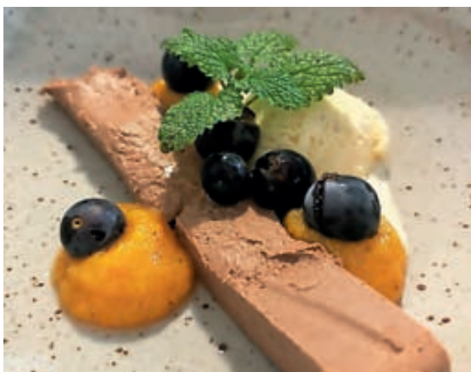
Martinova sladica

V petek pred martinovim smo v Dvorcu Visoko počastili praznik sv. Martina.