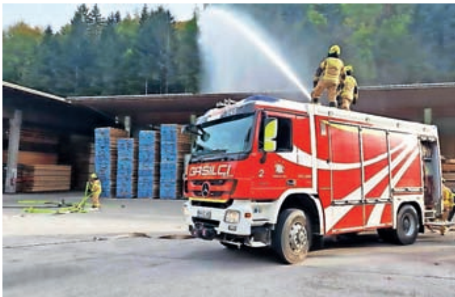
Gasilci vseh sedmih gasilskih društev v občini so oktobra izvedli skupno vajo ob mesecu požarne varnosti in preverili usposobljenost ekip.