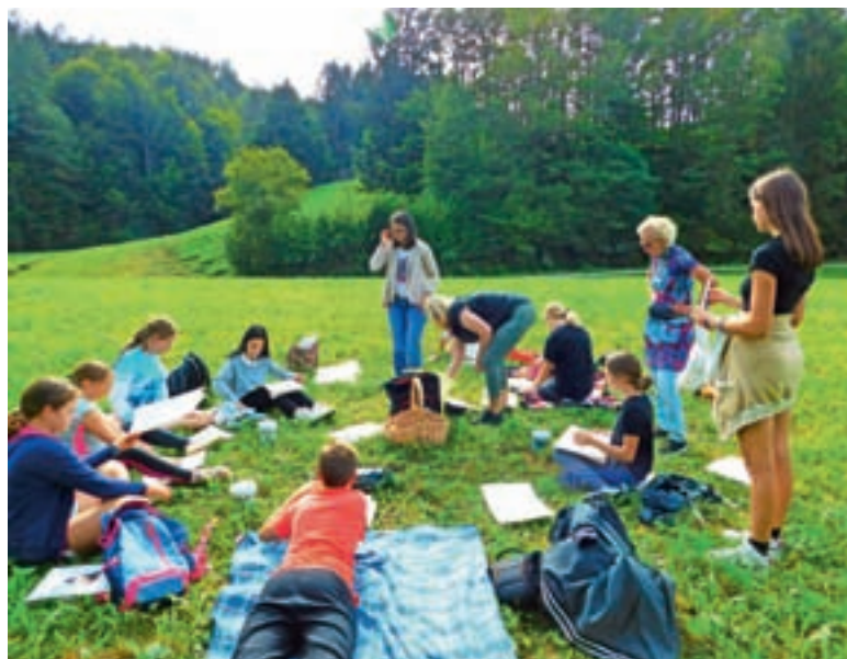
Bralno-ustvarjalno popoldne

Šestnajsti oktober velja za svetovni dan oživljanja. Več učiteljev in vzgojiteljev se je izobraževalo za posredovanje v primeru