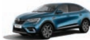
RENAULT MEGANE CONQUEST Techno TCe 140 EDC* VFIRJL00XUC419031