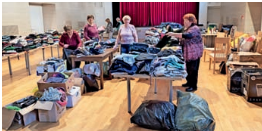
Tudi na jesensko zbiralno akcijo so se občani zelo dobro odzvali, prostovoljke pa so dežurale ves dan.