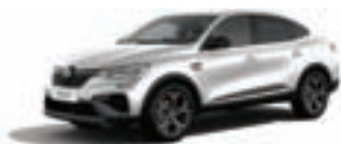
RENAULT MEGANE CONQUEST R.S. Line TCe 140 EDC VFIRJL006UC382429