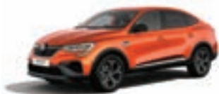
RENAULT MEGANE CONQUEST R.S. Line TCe 140 EDC VFIRJL008UC422204